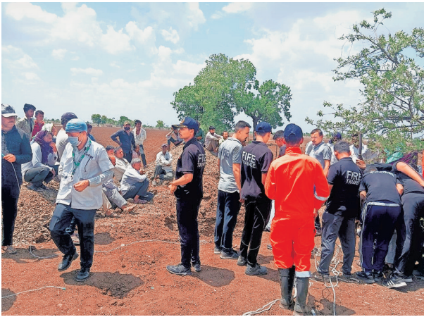
Efforts underway to rescue the one-and-a-half-year-old girl who fell into the borewell around 12 pm on Friday. Express

"The girl is stuck at a depth of approximately 50 feet. A team of Amreli fire brigade has reached the spot and launched a rescue operation. A team of the health department has also reached the site and are pumping oxygen into the borewell," the SP further said, adding, "We have also